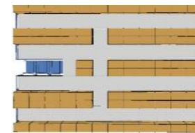
Hagyományos lemezpolcos állvány

A kommissiózó teljesítménye jelentősen optimalizálható. Különösen magas áruforgalom esetén lehet igazán profitálni az AKL rendszerből. A kompakt építésű rendszer által értékes raktárterület nyerhető: a hagyományos raktárrendszerhez képest akár 20% extra felület.