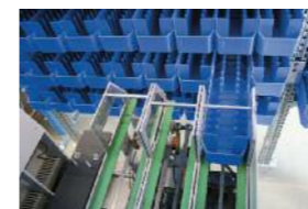
Merevítők és lemezpolcok kapcsolódása.

Könnyű, tömör rakategységekkel kombinálva optimalizálható az AKL helykihasználása. Gyors, közvetlen hozzáférés segíti az optimális árumozgatást. 25 milliméterenként állítható a tárolószint magassága – egyedileg alakítható az adott követelményekhez.