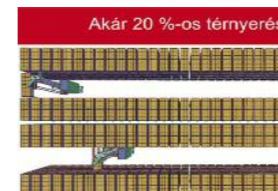
Automatikus apróalkatrész raktár