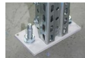
A talajegyenletlenség kiküszöbölése állítható talplemezekkel.